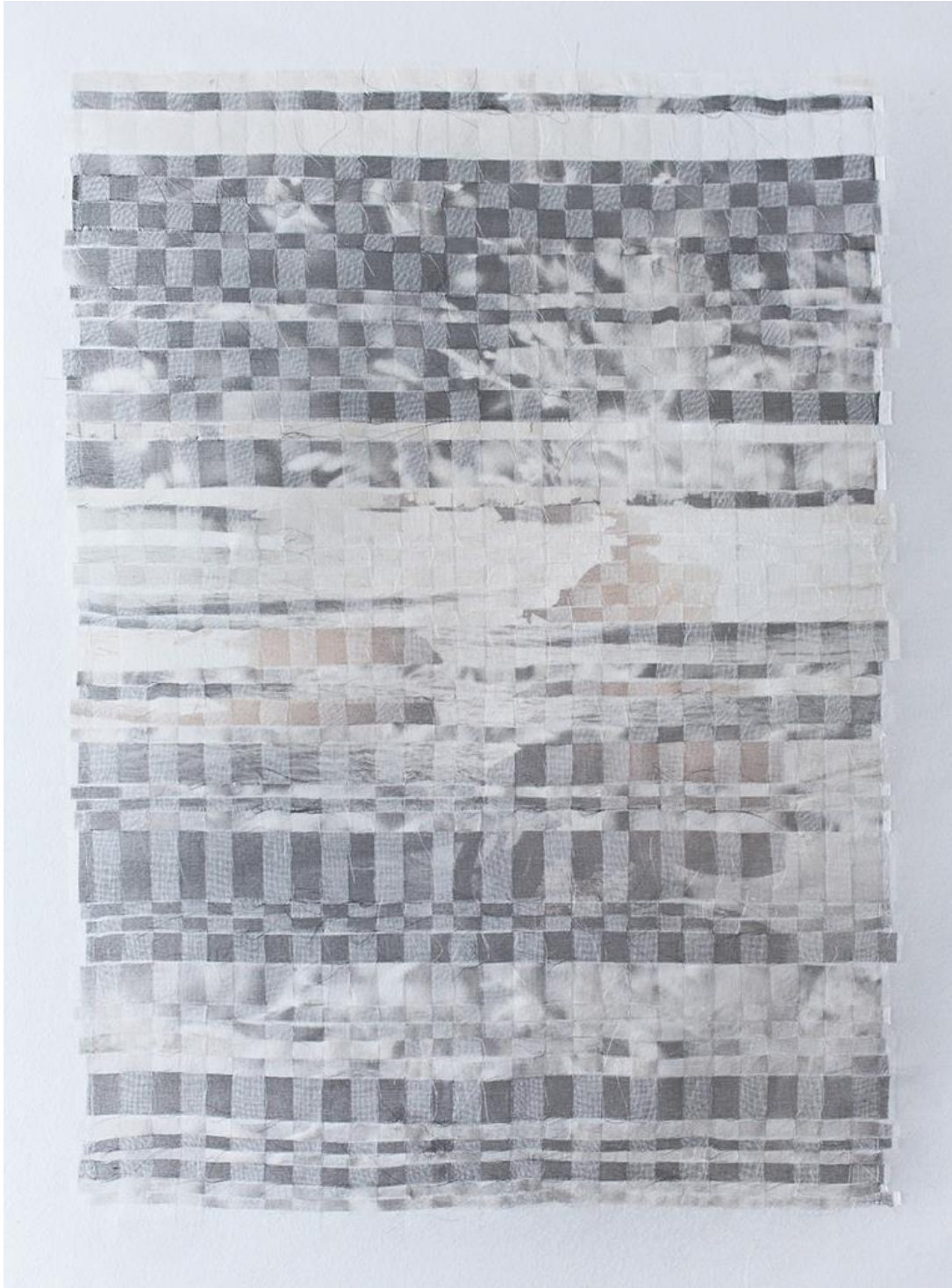
In Between XXII aus der Arbeitsserie „In Between“, Motive auf Seidenorganza gedruckt, geschnitten und gewebt, 40 x 30 cm, 2024