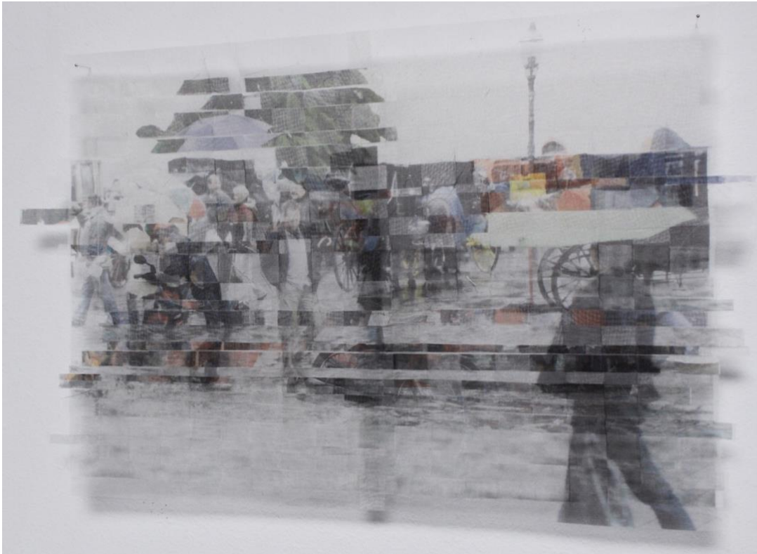
In Between XXII aus der Arbeitsserie „In Between“, Motive auf Seidenorganza gedruckt, geschnitten und gewebt, 40 x 30 cm, 2024